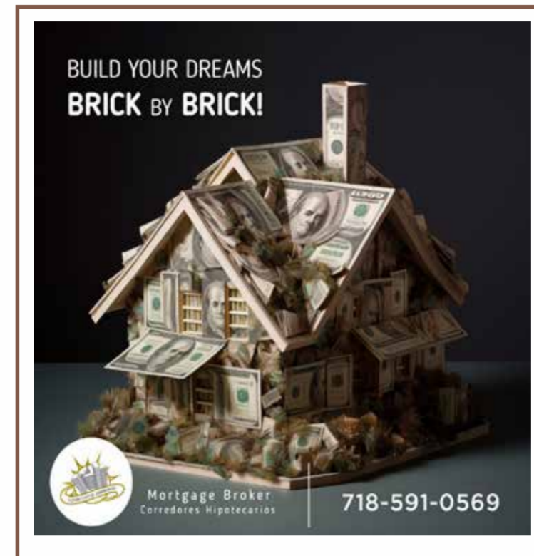
Cuarto de Página (4.25" x 5.5")