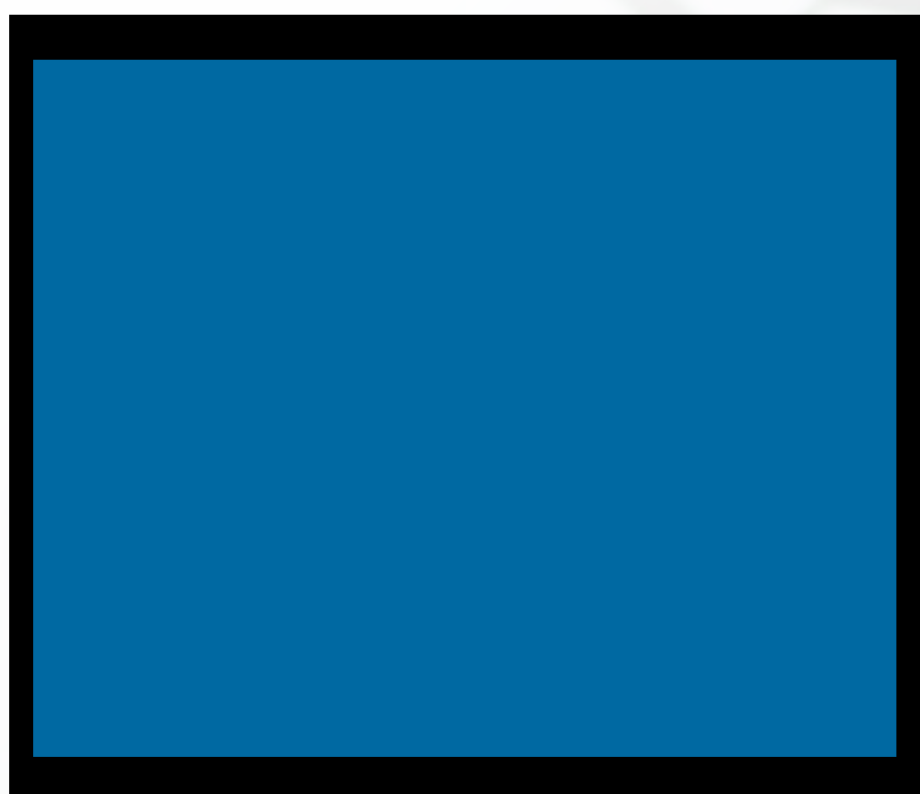
Banner Digital (para redes y web)

Advertencia: El tamaño de este formato varía según el medio digital en el que se presente, ya que las medidas no siempre son las mismas. Por favor, consulte con las personas correspondientes.