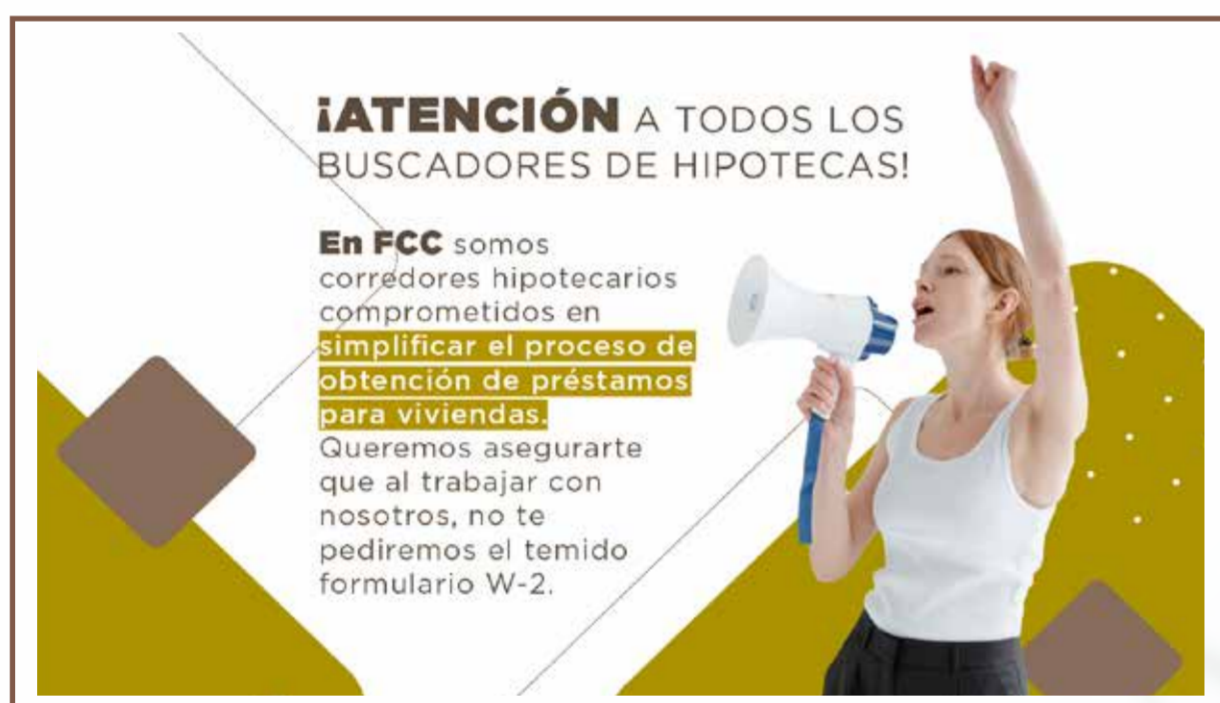
Media Página (4.25" x 11")